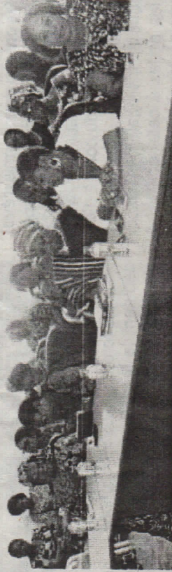
Vue partielle des participants

L'AFCET a été créée en 2001 par les femmes chefs d'entreprises